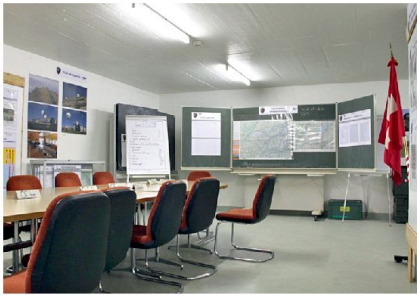
Rapportraum im KP militärische Führung.

Die ständige Verbesserung und Verstärkung des Dispositivs «AERO SUBITO» ist unser Hauptanliegen. Aus diesem Grund wird im Laufe des Oktobers 2012 wieder eine Übung stattfinden; sie beinhaltet hauptsächlich die Ablösung von