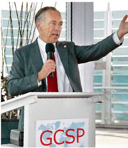
Botschafter Dr. Fred Tanner.

die Aktivitäten des Zentrums bereitwillig und verfolgen sie wohlwollend. Auch nicht, weil die Kernaufgaben des GCSP unlösbare Probleme verursachen würden: Die Kurse und weitere Aktivitäten des Zentrums werden von einem lokalen und internationalen Lehrkörper ausgezeichnet sichergestellt. Schlussendlich auch nicht wegen der Aktivitäten vergleichbarer und manchmal konkurrierender Institute: Der Bedarf an Bildung in Sicherheitspolitik ist weltweit gross und schnell zunehmend, die Nachfrage nimmt mindestens so schnell zu wie das Angebot. Trotzdem gibt es erhebliche Schwierigkeiten. Das