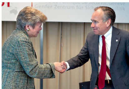
Frau Rose Gottemoeller, stellvertretende Aussenministerin für Rüstungskontrolle und internationale Sicherheit, spricht im GCSP am 20. März 2013.