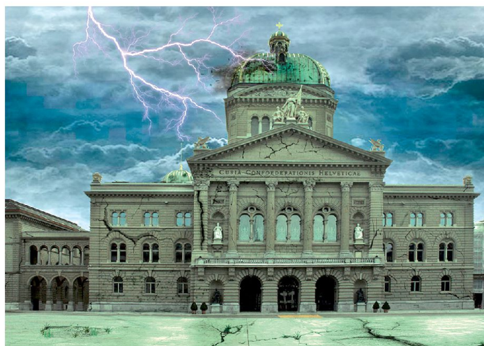
Im Gewitter ausländischer Mächte: Widerstand oder Unterwerfung?

Der pauschale Vorwurf der USA und die pauschale Forderung an die Schweiz lauten: Die Schweizer Banken haben nicht versteuertes Geld entgegengenommen, die Schweiz hat ab sofort für die USA Steuerpolizei zu spielen.