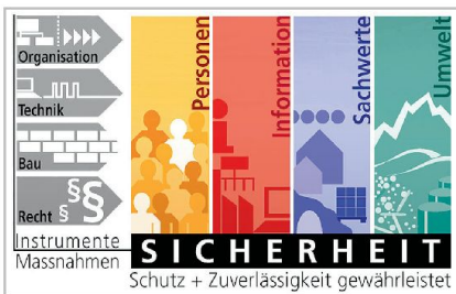
Grafik Sicherheit; Massnahmen und geschützte Einheiten.

übersichtlicher und vollständiger Form präsentiert. Das neue Reglement ist zugleich ein klar gegliedertes Hilfsmittel, um Basiswissen nachzuschauen oder auch an die Zielgruppen weitervermitteln zu können. Das gesamte Feld von Risiken und Bedrohungen über Rollen und Verantwortlichkeiten bis zu konkreten Sicherheitsmitteln wird abgedeckt. Welche Klassifizierungsstufen von Informationen gibt es? Welcher Stufe entspricht ein ausländisches Dokument, welches als «RESTRICTED» klassifiziert ist? Solche Fragen werden im Reglement einfach und übersichtlich beantwortet. Zusätzlich veranschaulichen