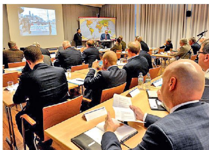
CIOR-Seminar 2013, Arbeitsgruppe.

In seinem Referat zeigte Professor Nikitin (Russland) auf, dass die Erweiterung des Bündnisses von derzeit noch 28 Mitgliedstaaten zu ernsthaften Bedenken Anlass gebe, nicht zuletzt auch deshalb, weil doch viele dieser Mitgliedstaaten instabil und ökonomisch nahezu bankrott seien, was zu einer nicht nur vorteilhaften Abhängigkeit von anderen Ländern führe.