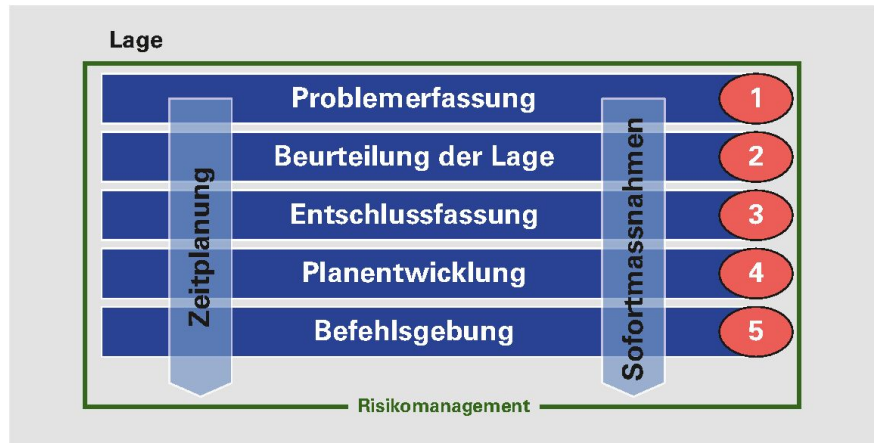
Führungstätigkeiten [FSO 17, Abb. 3].

In verschiedenen kleineren Anpassungen wird festgehalten, dass der Kommandant erweitert Einfluss nehmen kann und soll. Bei der Lagebeurteilung legt er fest, welcher der gefährlichsten oder aber wahrscheinlichsten gegnerischen Möglichkeit weiter gefolgt werden soll. Das Risikomanagement wird ebenfalls zur Kommandantensache erklärt. Diese Beispiele zei-