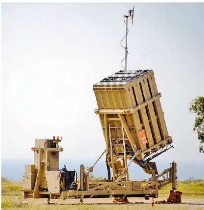
Israel verfügt mittlerweile über 9 Iron Dome Batterien. Das Raketenabwehrsystem fängt Projektile ab, die in bewohntes Gebiet einschlagen würden.

Bislang kann von einer einheitlichen Regierung beider palästinensischen Gebiete jedoch keine Rede sein, da die Hamas nicht bereit ist, die Kontrolle über den Gazastreifen aufzugeben. Dennoch hat sich deren Ausrichtung verschoben: Formell übertrug die Hamas die Verwaltung und Regierung des Gazastreifens an die neue Regierung in Ramallah. Damit befreite sie sich von der Verantwortung gegenüber der Bevölkerung Gazas und konnte sich fortan wieder verstärkt auf ihr militantes anti-israelisches «Kerngeschäft» konzentrieren. Insofern hat die Bildung der Einheitsregierung wesentlich zur jüngsten militärischen Eskalation beigetragen.