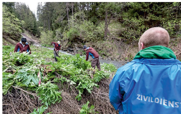
Zivildienstleistender im Einsatz.

Zivildienstler leisten einen achtbaren Dienst an der Gemeinschaft. Im Rahmen der Studie «Dienstpflicht» ist er zu überprüfen. Freiwilliger Zivildienst ist dabei