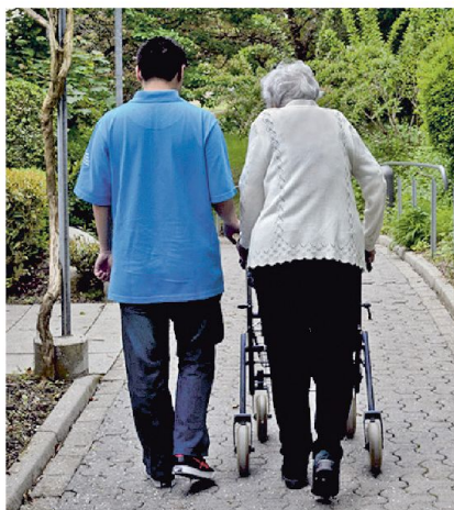
Zivildienstleistender im Einsatz.

Die Auswertung liegt noch nicht vor. Trends: Der neue Einsatzbereich «Schulen» ist umstritten. SVP und FDP sind dagegen; die CVP ist grundsätzlich dafür, möchte ihn aber auf Assistenzhilfe begrenzen. Linke und der Zivildienstverband sind dafür. Pro Militia und AWM äusserten sich zusammengefasst wie folgt: • Effektivbestand der Armee darf durch Zivildienstleistende nicht gefährdet werden;