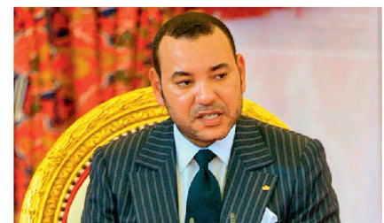
Mohammed VI, König von Marokko.

seiner Thronbesteigung im Jahre 1999 verfolgt der in Frankreich promovierte König eine machtpolitische Transformation von oben. So versucht Mohammed VI schlau, die vorhandenen gesellschaftlichen Spannungen zu neutralisieren, um so letztendlich die eigenen Privilegien nicht zu gefährden und sie für die Zukunft seiner Familie zu sichern.