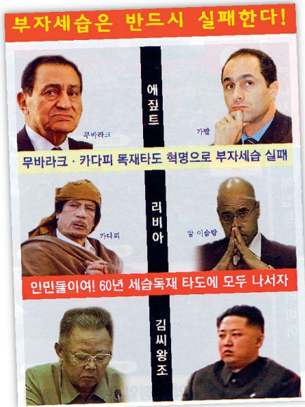
Flugblatt (Vorder- und Rückseite) welches unter Hinweis auf Libyen und Ägypten zum Aufstand in Nordkorea aufrief, was realitätsfremd war.

dio Freies Chosun» mit seiner täglichen drei-Stunden-Sendung. Im Januar 2008 war erstmals das «Radio für Reformen in Nordkorea» zu hören, welches sich jeden Tag eine Stunde speziell an die dortige kommunistische Führungsschicht wendet. Im Jahr 2004 wurde zwischen Seoul und Pjöngjang feierlich ein Vertrag unterzeichnet, welcher die Einstellung jeglicher staatlicher Propaganda gegen den jeweils anderen Landesteil stipuliert. Forderungen des Nordens, die jetzigen Aktivitäten der Flüchtlingsgruppierungen zu verbieten, hat Seoul stets mit dem Argument zurückgewiesen, es handle sich hierbei um private Organisationen, welchen das Recht auf freie Meinungsäußerung zustehe. Die südkoreanische Regierung nimmt diese subversiven Tätigkeiten zur