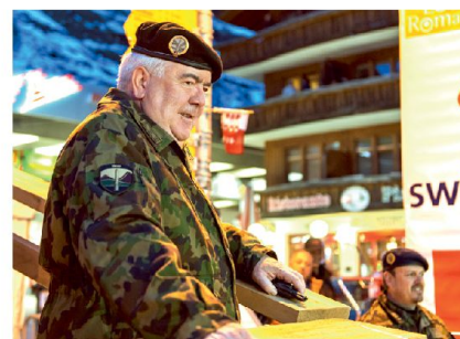
Ein sichtlich zufriedener Kdt Heer!