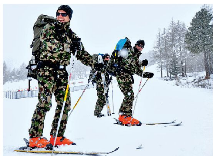
Harte Vorbereitungsarbeit vor den Rennen.

fordert. So musste am Start und im Ziel die Logistik funktionieren, die Materialkontrolle durchgeführt und die Verpflegung organisiert werden. Flexibilität war während dieser Tage Pflicht. So wurden die Starts beider Läufe wegen grossem Schneefall aus Sicherheitsgründen um jeweils 24 Stunden verschoben. Nebst freiwillig Dienstleistenden waren auch diverse Milizverbände beteiligt. Insgesamt standen 1500 Armeeangehörige im Einsatz, welche zusammen zwischen 8000 bis 10000 Dienstage verbuchten, unter ihnen auch diverse Spezialisten. So konnten die Organisatoren, das erste Mal kommandiert von Oberst Max Contesse, auf 40 Ärzte und 40 Köche zurückgreifen. Letztere bereiteten 75 000 Mahlzeiten zu. Für die Sicherheit standen drei Meteorologen und 16 Lawinenhunde sowie sechs Lawinenspezialisten im Einsatz. Damit die Spezialisten und Helfer jedoch effizient arbeiten und beherbergt werden konnten, wurden rund 210 Tonnen Material in 50