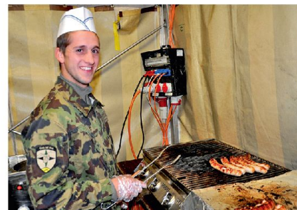
Auch am Grill bewiesen die Soldaten ihr Geschick!

Unbestreitbar bedeutet die PdG eine körperliche, aber auch mentale Herausforderung für begeisterte Schneesportler. Während die kurze Strecke von Arolla nach Verbier mit 26 zurückzulegenden Kilometern zu Buche schlägt und dank der Walliser Gipfel auf 53 Leistungskilometer kommt, sind bei der 53 Kilometer langen Strecke von Zermatt nach Verbier 110 Leistungskilometer zu überwinden. Beachtlich auch die Profile: So sind es bei der kurzen Strecke 2000, bei der langen gar 4000 Höhenmeter, welche überwunden werden müssen. Dabei sind unter anderem der Tête Blanche auf 3650 Metern über Meer und der Col de Bertol auf 3268 Metern zu bezwingen. Umso erstaunlicher die Resonanz. Ganze 1772 Patrouillen und somit 5316 Sportler sorgten bei der diesjährigen Ausgabe für einen neuen