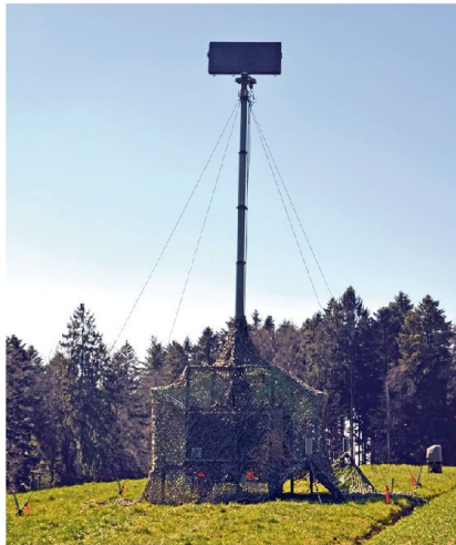
Alarmsystem ALERT: im 24 Stunden Einsatz; frühe und genaue Erkennung.

Das generelle WK-Ziel einer Flab Abt ist die Erreichung/Erhaltung der Grundbereitschaft (Fit for Mission) auf Stufe Einheit und Truppenkörper. Die Über-