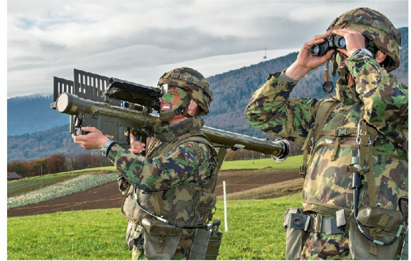
Feuerinheit STINGER: höchste Mobilität und immer das Ziel vor Augen.

eingesetzt. Im Luftraum ist die Luftwaffe mit ihren Kampfflugzeugen und Fliegerabwehrmitteln für alle Lagen zuständig. Dabei nimmt die Fliegerabwehr für den Schutz ziviler und militärischer Objekte (inklusive dem Schutz von Formationen)