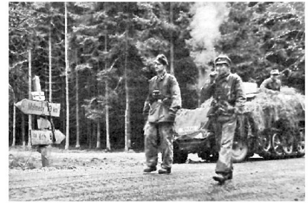
Kampfgruppe Peiper auf dem Vormarsch Richtung Malmedy.