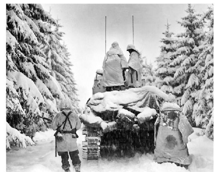
US Panzer und Infanterie auf dem Marsch.

Damit Luftlandtruppen kurzfristige Aufträge ausführen können, müssen sie entsprechend vorgängig ausgebildet und ausgerüstet sein. Beide Voraussetzungen waren für von der Heydte nicht gegeben.