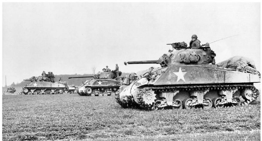
US Sherman Panzer wie sie in Europa eingesetzt wurden.

Unternehmen Stösser ist eine Luftlandung von rund 1300 Fallschirmjägern in der Region von Malmedy/Hohen Venn. Der Auftrag lautet: Wichtige US-Nachschublinien bis zum Eintreffen der vor-