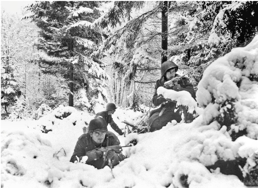
US-Infanteristen des 290th Regiment im Waldkampf in der Nähe von Amonines.

durchbrechen. Sie sprengen ein Munitionslager, leiten US-Truppen um und stiften Unruhe. Einzelne Greif-Soldaten in US-Uniformen werden gefangen genommen und standrechtlich erschossen. Am 28. Dezember 1944 ziehen sich die restlichen Verbände der Pz Br 150 von der Front zurück. Sie werden am 23. Januar 1945 aufgelöst.