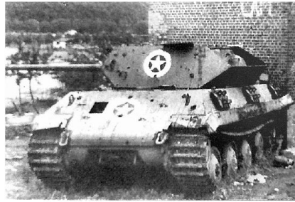
Optisch veränderter deutscher Panzer Panther.

Skorzeny erfährt am 21. Oktober 1944 von den Plänen für das Unternehmen Greif. Der Führer versprach Skorzeny 2000 Düsenjäger für die Luftüberlegenheit während der Offensive! Am 25. Oktober 1944 beginnt die Rekrutierung von englisch sprechenden Wehrmachtssoldaten. Am 2. November 1944 startet die Requirierung von erbeutetem US-Material und bis am 25. November 1944 soll die Planung beendet sein. Am 10. Dezember 1944 informiert Skorzeny seine Kommandanten über die Details und am 13. Dezember 1944 verschiebt die nicht vollständig mit dem versprochenen US-Material ausgerüstete Pz Br 150 in die Ausgangsstellung. Um die geringe Zahl der Original US-Panzer zu verschleiern, werden Panther-Panzer optisch verändert, um