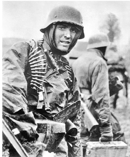
Deutscher Soldat während der Ardennenoffensive.

stossenden deutschen 12. SS-Panzerdivision «Hitlerjugend» zu unterbinden. Das Unternehmen steht unter dem Kommando des erfahrenen Oberst Friederich August von der Heydte. Er erfährt am 8. Dezember 1944 von den Plänen für das Unternehmen Stösser und am 9. Dezember 1944 zieht er die ersten Fallschirmjäger in Aalten zusammen. Zwei Tage später wird er über die Details/Ziele von Stösser informiert. Am 13. Dezember 1944 erhält seine Kampfgruppe die Ausrüstung und verschiebt in die Nähe der vorgesehenen Flugplätze.