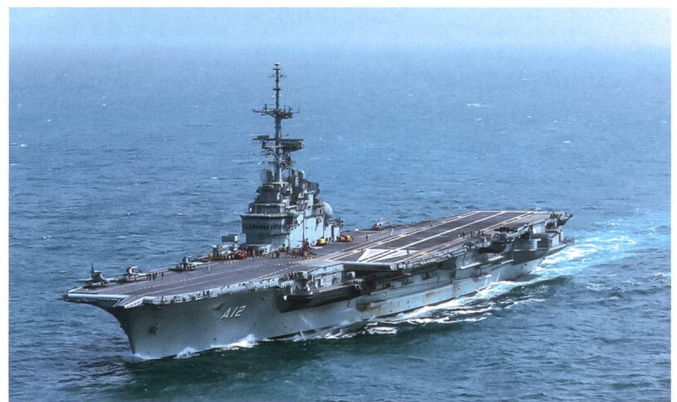
Flugzeugträger Sao Paulo.

Auch Kolumbien geht sachte an die Neuausrichtung der Verteidigungsstrategie heran. Nachdem der praktische Frieden mit der linken Guerilla doch landesweit eine Normalität ist, werden die Streitkräfte auf ein «post-Konflikt-Szenario» ausgerichtet. Vorerst geschieht dies durch personelle Veränderungen im Kommando der Armee, Marine und Luftwaffe. Änderungen der Doktrin sollen zu einem späteren Zeitpunkt erfolgen.