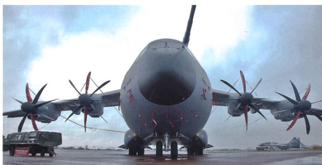
Erster Airbus A400M der RAF auf der Brize Norton Airbase.

Die königliche Luftwaffe verfügt seit Ende Juli 2015 über ihre designierte operationelle Airbus A400M ATLAS-Einheit. Das 70 Squadron mit seinem Motto «Usquam» (lat. Irgendwo) wurde als jenes Geschwader bestimmt, das ab 2022 seine volle Einsatzkraft erlangt. Bisher wurden drei Transportflugzeuge des neuen Typs ausgeliefert, bis September sollen vier weitere folgen. In einer ersten Phase kann das Geschwader damit bis Ende Jahr den strategischen Lufttransport sicherstellen. Die nächste Phase sieht ab 2016 vor, im non-permissiven Umfeld Operationen durchzuführen sowie Unterstützung zwi-