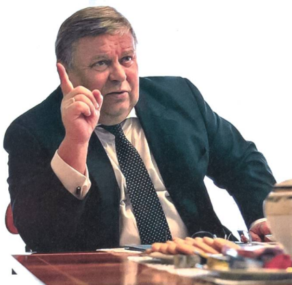
Viktor Tatarintsev, russischer Botschafter in Schweden.

Vor kurzem hat die schwedische Regierung ihre Ambitionen der NATO beizutreten bekräftigt. Russland droht