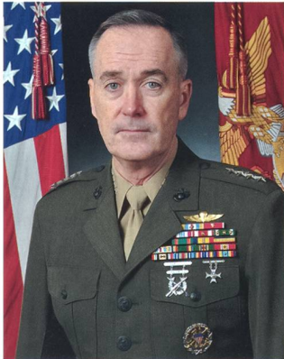
US Marine Corps General Joseph Dunford.

Präsident Barack Obama nominierte am 5. Mai US Marine Corps General Joseph Dunford für den Posten des Vorsitzenden der Vereinigten Stabschefs (Chairman, Joint Chiefs of Staff, JCS). Er soll den amtierenden JCS Chairman, Army General Martin Dempsey, ablösen, der in Pension geht. Zwar Bedarf die Ernennung Dunfords der Bestä-