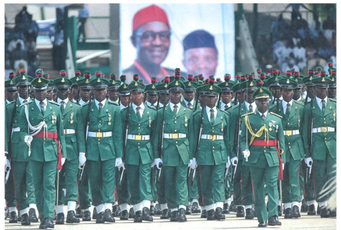
Nigerianische Soldaten bei der Vereidigung des Präsidenten Muhammadu Buhari.

Buhari gelang damit, was seinem Vorgänger verunmöglicht blieb. Er erhielt vom US-Präsidenten während eines kürzlich erfolgten Besuches in Washington die Zusage um Unterstützung gegen die islamistische Boko Haram Miliz. Grundsätzlich verbietet die amerikanische Justiz den Verkauf von gewissen Rüstungsgütern an Länder, in welchen Streitkräfte