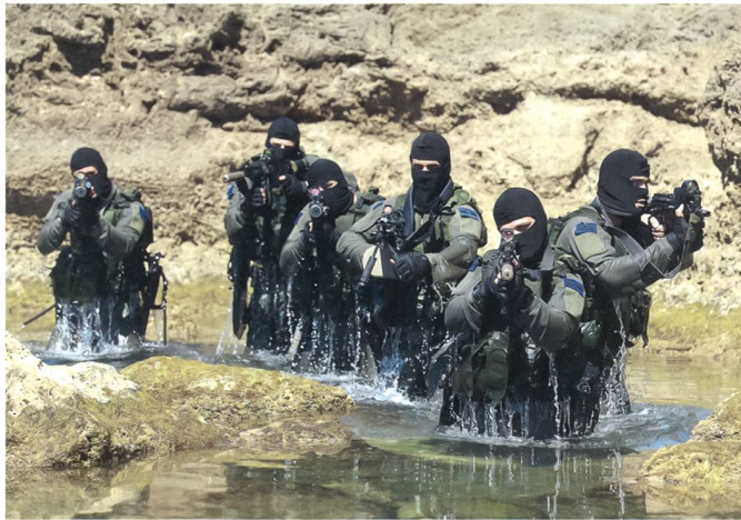
Shayetet 13 (Flotilla 13) beim Training.

Stabsoffizier, und weiter: «es gehe nicht darum, wie das Ganze organisiert ist, sondern dass wir alle nun eine konzeptionelle Revolution durchmachen.» Darauf basierend schlägt Generalmajor Nimrod Shefer in die gleiche Kerbe und meint: «...weil es in Zukunft vielleicht weniger