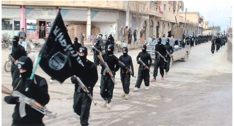
... und wie viele davon gehören dem IS an?

Es lässt sich nicht leugnen, dass bereits die bisherige Vorgehensweise der europäischen Regierungen in der Migrationsfrage, aber vor allem das Verhalten der in den Medien ständig präsenten Befürworter einer grenzenlosen Aufnahmebereitschaft zu weiteren innergesellschaftlichen Konflikten führen wird. Dies liegt nicht allein in der grossen Zahl der Migranten und der Tatsache begründet, dass die meisten von Afrika über das Mittelmeer nach Europa kommenden Menschen Muslime sind und die ohnehin kaum zu bewältigende Problematik der in Europa präsenten streng islamisch geprägten «Parallelgesellschaften» noch vergrössern. Angesichts der chaotischen Verhältnisse nach der Ankunft der Migranten auf europäischem Boden wächst auch die Sorge, dass zunehmend islamistische Kämpfer in die EU gelangen. Nach den Erkenntnissen westlicher Geheimdienste zahlen die Terrororganisationen den Schlepperbanden für jeden nach Europa gebrachten Kämpfer 10000 Dollar. Insbesondere die äusserst flexibel und transnational agierende Terrormiliz IS macht sich diese spezifischen