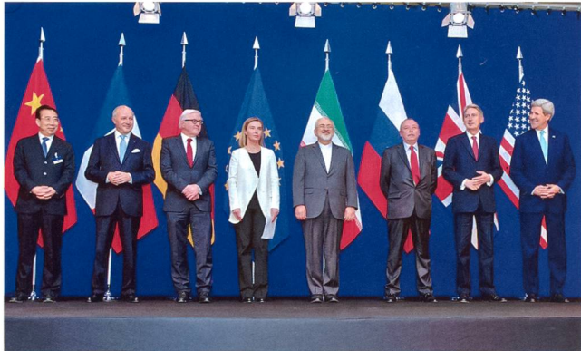
Die Aussenminister von Frankreich, Deutschland, der EU, Iran, des Vereinigten Königreichs und der USA sowie chinesische und russische Diplomaten in Lausanne.

Am 14. Juli einigten sich die sechs Mächte auf den Joint Comprehensive Plan of Action (JCPOA) mit Iran. US-Präsident Barack Obama versprach im Brustton der Überzeugung: «Damit ist jeder einzelne Pfad Irans zu einem Atomprogramm gestoppt.» Ist dieses Versprechen einzuhalten? Was bezweckt der «Deal»? Wie ist er geopolitisch einzustufen?