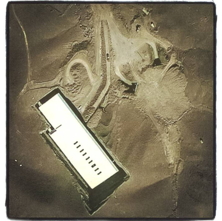
Anreicherungsstation in Fordo.

Für Iran bedeutet das Abkommen das Ende einer jahrzehntelangen aussenpolitischen Isolation, die seit 1979 den Spielraum des Landes eingengt hatte. Auch