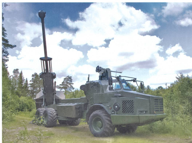
ARCHER System.

dazu bewog, sich im Jahr 2013 aus diesem Geschäft zurückzuziehen. Seit dem gleichen Jahr standen die ersten Prototypen dann dennoch im schwedischen Truppenversuch und so rechnet das Königsreich demnächst mit 24 Systemen, um damit zwei Artillerieabteilungen ausrüsten zu können.