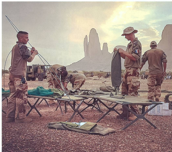
Nachtlager französischer Soldaten in Mali.

ein Abschluss sämtlicher Formalitäten hinsichtlich der Entwicklung eines neuen Kampfpanzers durch die staatlich-französische Nexter und die deutsche Krauss-Maffei-Wegmann noch Ende dieses Jahres erwartet. Die beiden Firmen fusionierten im Juli 2015 zum Rüstungsriesen KANT (Krauss Maffei Nexter Together). Zudem werden 25 schwere, gepanzerte Fahrzeuge für die französischen Spezialkräfte und leichte Fahrzeuge im Wert von etwa 250 Mio. beschafft. Derzeit läuft die Evaluation des von Renault Trucks Defense hergestellten SHERPA Light, welcher spezifisch auf die Bedürfnisse der Endnutzer angepasst werden muss. Die Forces Spéciales erhalten bis 2019 auch eine personelle Aufstockung von geplanten 1000 zusätzlichen Soldaten.