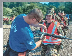
Abb. 3: Kein Einsatz ohne Ausbildung. Die Kooperation mit dem GWK bewährte sich auch in der EBA.

Die Stärke eines Trp Kö Stabs besteht in seiner Flexibilität. Dank den Erfahrungen und Kompetenzen seiner Mitarbeiter kann er sich immer wieder zeitgerecht auf neue Herausforderungen einstellen. Die vorgeschlagenen strukturellen Anpassungen unterstützen dies, indem sie der Wichtigkeit der Ausbildung und der gewachsenen Bedeutung der Medien Rechnung tragen.