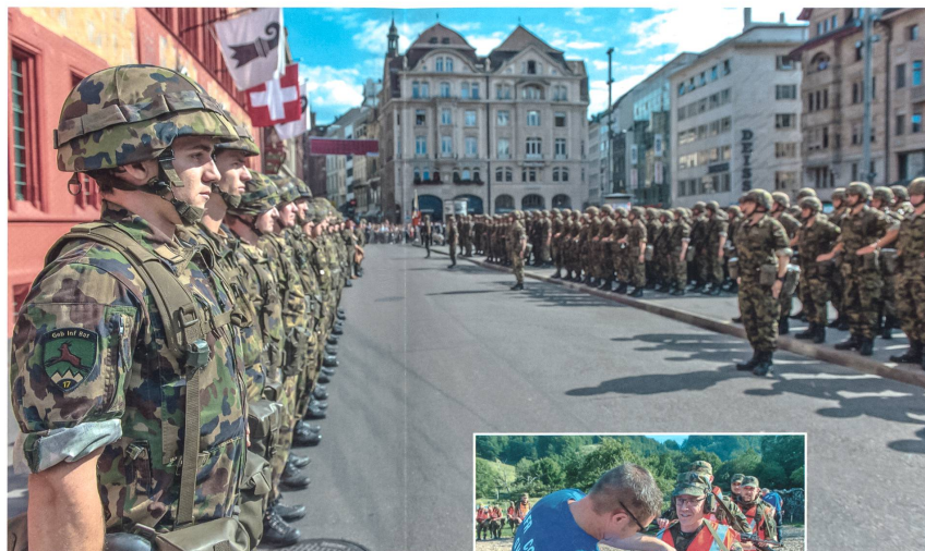
Abb. 2: Aus Blogs wusste man, was an Störaktionen geplant war. Ein Dispositiv der Kantonspolizei ermöglichte den reibungslosen Ablauf der Fahnenrückgabe auf dem Basler Marktplatz.

Für die Truppe wurden allein während der Übung vier Ausgaben der Truppenzeitung «s'Gemschi» produziert, die mittels Fotos, Interviews und Berichten Hintergründe zum Bataillon, zum GWK und zur Ter Reg 2 lieferten. Dies wurde von den Soldaten sehr geschätzt.