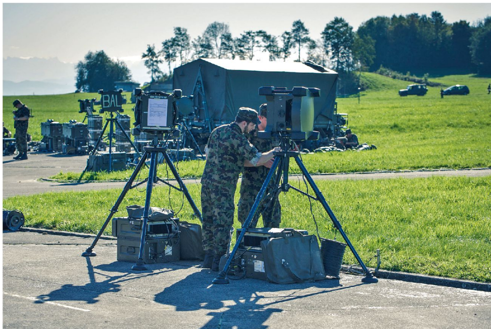
Richtstrahl-Station im Aufbau.

Auf Basis der Freigabe der RUAG baute das Ristl Bat 17 das Mikrodispo wieder ab und verschob alle Richtstrahl-Installationen an die 30 geplanten Standorte des SAT. Insgesamt wurde für «INTERARMASUISSE 41» ein Netzwerk mit 58 Richtstrahlstationen, 14 Knotenver-