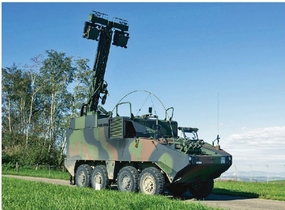
Mobile Richtstrahl-Station auf Panzer.

IMFS ist das taktische Telekommunikationssystem für Sprache und Daten. Es bietet hohe Mobilität, Informationssicherheit und Stabilität, dies dank einer vernetzten Netzwerk-Architektur. Diese Architektur sorgt dafür, dass bei Ausfall eines