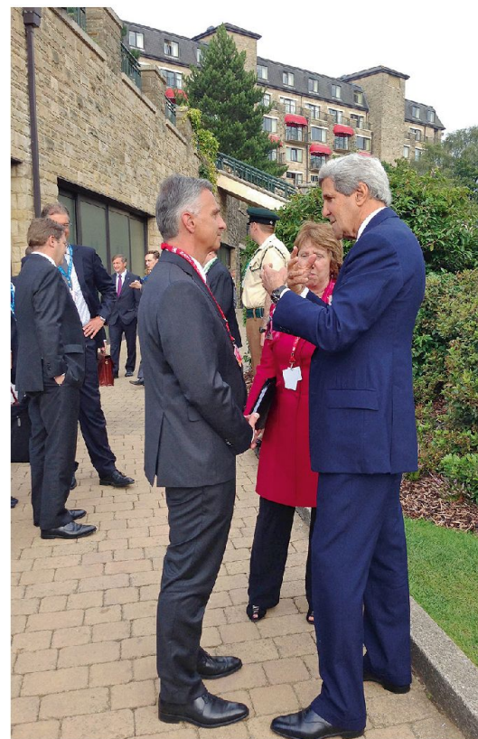
Treffen mit John Kerry (USA) und Catherine Ashton (EU) beim Gipfeltreffen der NATO in Newport (Wales) am 5. September 2014.

Die Ukrainekrise hat aufgezeigt, dass grundsätzliche Annahmen zur europäi-