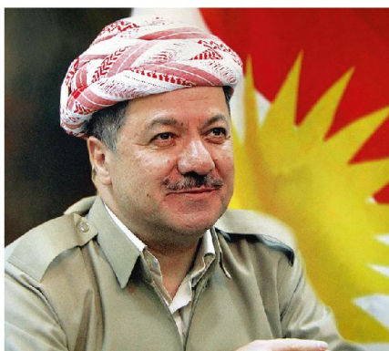
Der kurdische Regionalpräsident Masud Barzani.

gen Anlagen auf den Feldern Bai Hassan und Kirkuk. Dort werden täglich bis zu 400 000 Barrel Rohöl gefördert. Der Ausserminister der kurdischen Regionalregierung Falah Mustafa Bakkir erklärte dazu: «Ministerpräsident Maliki hat einseitig und unrechtmässig das Budget der Region Kurdistan gekürzt und die Gehaltszahlungen an die Beamten eingestellt. Wir mussten handeln, um die Dienstleis-