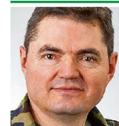
Brigadier Hans Schatzmann lic. iur. Kdt Infanteriebrigade 5 3380 Wangen an der Aare

Die Hauptaktion im Zernierungsraum wurde vom verantwortlichen Kp Kdt mit den 8,1 cm Mw eröffnet. Indem Beleuchtungsgeschosse auf das Angriffsziel geschossen wurden, gleichzeitig ein gegne-