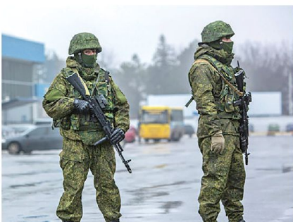
Russische Soldaten mit moderner Ratrik-Ausrüstung Ende Februar 2014 auf der Krim.

Die US-Definition der hybriden Bedrohung (Vermischung irregulär – regulär) scheint daher zu kurz zu greifen. Gerade aus der Sicht eines Kleinstaates wie der Schweiz richten sich moderne Bedrohungsformen, von wem sie auch immer ausgehen mögen, nicht mehr gegen die Integrität des Staatsgebietes und auf einen territorialen Gewinn aus, sondern vermehrt gegen das Funktionieren eines Staates und seiner Institutionen. Ein oder meh-