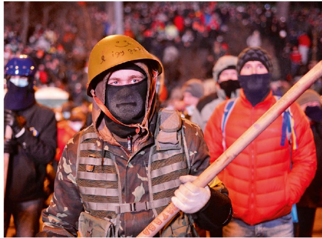
Demonstranten auf dem Maidan-Platz in Kiew.

Die US-Sichtweise ist aber nur die eine Seite der Medaille. Hybride Formen der Kriegführung können auch offensiv angewendet werden, um Staaten zu bedrohen und zu Zugeständnissen zu zwingen. Denn aus der Sicht des Westens kann die Art der Kriegführung, die Russland im Rahmen der Krise in der Ostukraine und bei der Landnahme der Krim betrieb, ebenfalls als hybrid beschrieben werden. Jānis Bērziņš von der litauischen National