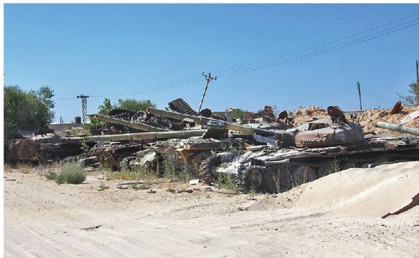
Nach alliierten Luftangriffen: Panzer bei Misrata.

Für das Versagen bei der Umsetzung des Prinzips der Schutzverantwortung ist der UN-Sicherheitsrat zu grossen Teilen selbst verantwortlich, da er die tatsächlichen Vo-