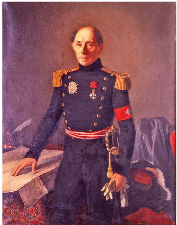
Général Guillaume-Henri Dufour (1787–1875).

La convention protège le personnel de secours aux blessés: selon les termes de