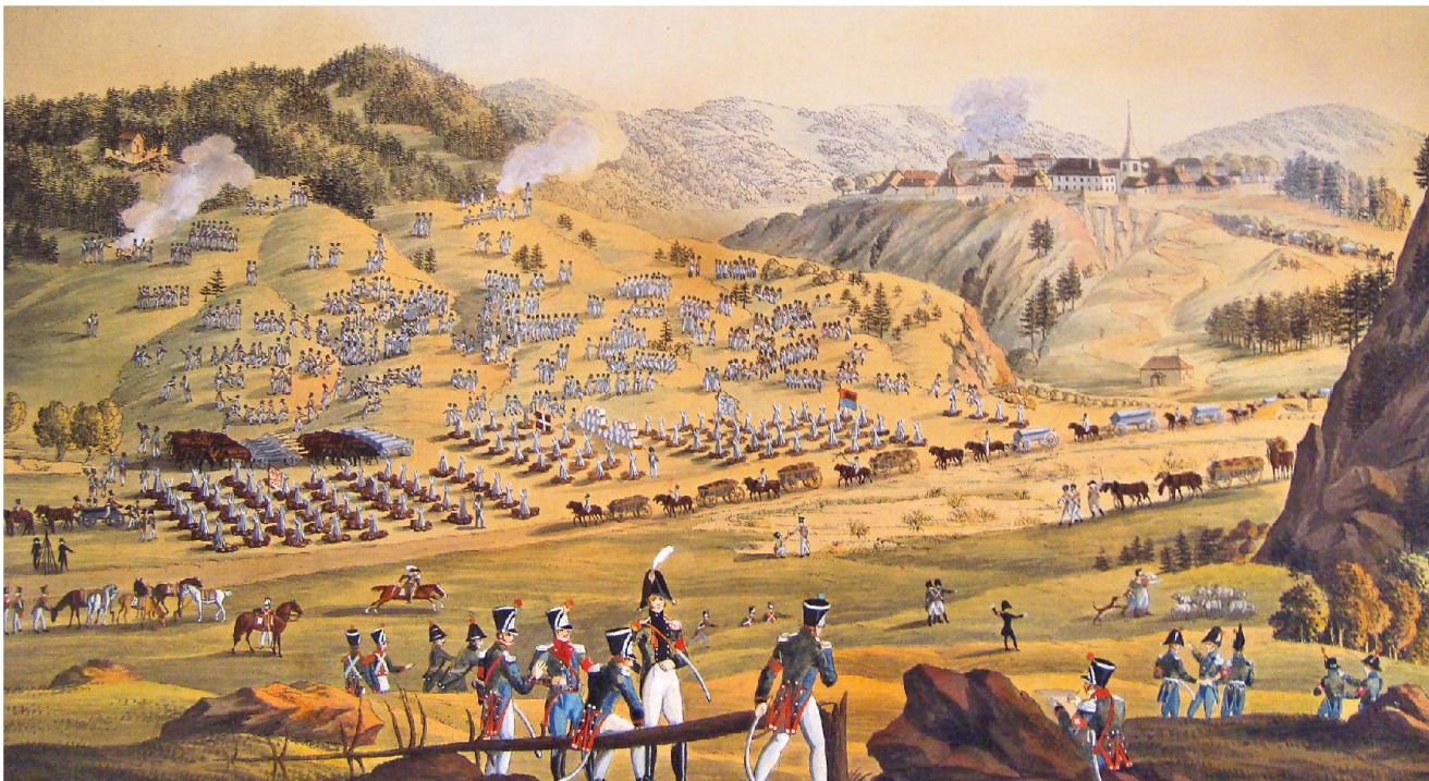
Eidgenössische Truppen im Besammlungsraum Jougne (F), nördlich von Vallorbe.