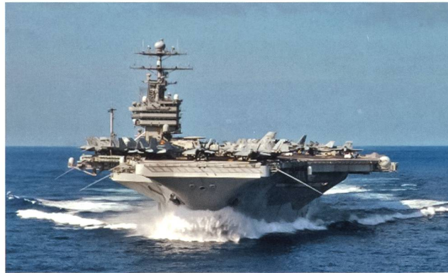
USS John C. Stennis (CVN 74), ein Flugzeugträger der 5. US-Flotte.

stärken. Daher käme König Salman ein Sturz des durch den Iran gestützten Präsidenten Assad in Syrien sehr gelegen. Gleichzeitig verliert die Familie Saud den Kampf gegen die schiitisch-libanesischen Terrororganisation Hisbollah – vom Iran massgeblich unterstützt – nicht aus den Augen. So kündigte die Regierung letztes