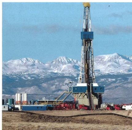
Schiefergasbohrung in der Pinedale-Antiklinale im US-Bundesstaat Wyoming.

gion für Washington nicht mehr von gleicher vitaler Bedeutung wie noch vor 30 Jahren. Ob bei dieser Tendenz die Verpflichtungen seitens der USA aus dem 1945 geschlossenen Pakt: «Öl gegen Sicherheit» auch in Zukunft aufrechterhalten werden, bleibt abzuwarten. Dank der