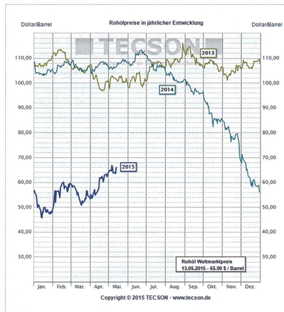
Entwicklung des Rohölpreises.

Im Kampf um die regionale Vormachtstellung in der Golfregion konnte Riad lange auf Washingtons geteilter Abneigung des Irans vertrauen. Doch jahrelang verhandelten die fünf UN-Veto-Mächte und Deutschland mit Teheran über dessen «ziviles» Atomprogramm und kamen im April zu einem «historischen Schritt», so US-Präsident Obama. Durch den Wegfall der westlichen Sanktionen und der garantierten Fortführung des «zivilen» iranischen Nuklearprogramms sprechen Kritiker von einem Verhandlungserfolg Teherans. Die Stimmung besonders in Israel, aber auch in Riad, sank auf den Nullpunkt. 2013 verzichtete das Land am Golf aus Protest gegen die Unfähigkeit, Probleme im Nahen Osten zu lösen, auf einen Sitz als nichtständiges Mitglied im UN-Sicherheitsrat – ein Novum in der Geschichte der Vereinten Nationen. Der Verhandlungserfolg Irans um sein Atomprogramm könnte neben dem internationalen Prestigegewinn auch Auswirkungen auf die schiitischen Bevölkerungsteile in der gesamten Region haben. Diese könnten selbstbewusster auftreten und mehr politische Mitsprache fordern. Während der Iran, Irak, Bahrein,