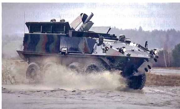
Mörser (Cobra auf Piranha, RUAG und General Dynamics).

kämpfen zu können. Eine grössere Reichweite hat ballistisch eine grössere Streuung und damit abnehmende Präzision bei der Wirkung im Ziel zur Folge. Durch den Einsatz längerer Geschützrohre, verbesserter Treibladungen sowie Massnahmen zur Geschosstabilisierung auf der Flug-