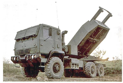
Operatives Feuer (HIMARS, Lockheed Martin).

Nach der Analyse der Ist-Situation und der hier aufgezeigten für das Schweizer System Artillerie benötigten Fähigkeiten muss im nächsten Schritt die Frage nach den geeigneten Plattformen für die Elemente der Wirkungskette Sensor-Entscheidsträger-Effektor angegangen werden. Geeignet bedeutet nicht nur das Ermöglichen der oben erwähnten Fähigkeiten, sondern auch eine hohe Benutzerfreundlichkeit. Auch die finanzpolitischen Rahmenbedingungen sind zu berücksichtigen. Auch für diesen Schritt ist