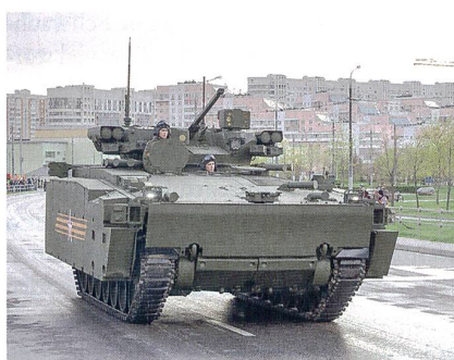
Verstärkter Seitenschutz beim Schützenpanzer «Kurganetz-25».

Kernstück der «Armata»-Familie ist der neue Panzer T-14, der wie der heute immer noch in Produktion stehende Panzer T-90 bei den Werken Uralvagon-