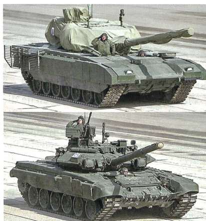
Grössenvergleich zwischen dem neuen Panzer T-14 und dem heutigen russischen Standardpanzer T-90S.

Ein signifikante Änderung bei den nun vorgestellten neuen russischen Kampffahrzeugen sind die verbesserten ergonomischen Bedingungen; das heisst, man hat westliche Konzepte übernommen und das Volumen der Fahrzeuge vergrössert