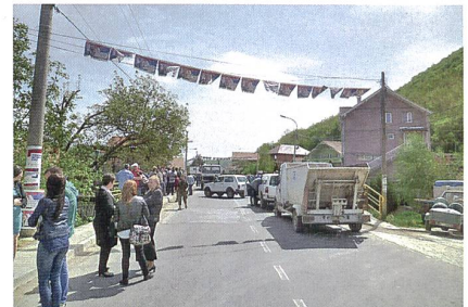
Abb. 4: Roadblock in Zubin Potok (18. April 2016).

und ob dieser eventuell für längere Zeit aufrechterhalten werden sollte. Dies natürlich möglichst diskret und ohne irgendwelche Risiken einzugehen. Es stellte sich heraus, dass für den 19. April in Brüssel sogenannte «technische Verhandlungen» zwischen einer serbischen und einer ko-