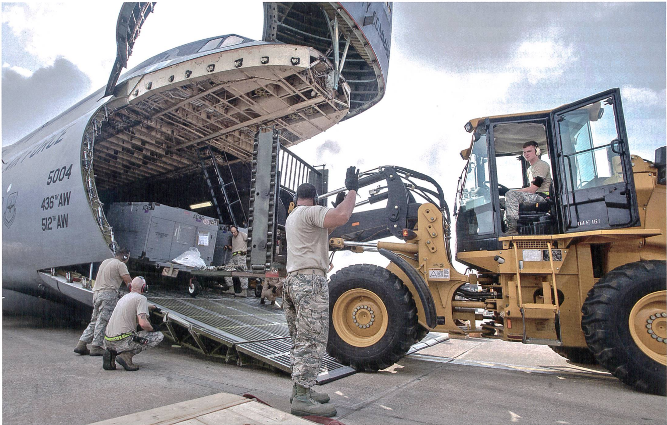
Beladen einer amerikanischen Super Galaxy auf der Incirlik Air Base in der Türkei.

es mit Mazedonien Beitrittsverhandlungen.