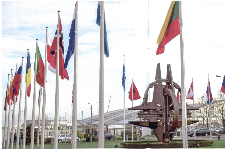
NATO-Hauptquartier in Brüssel.

Dass die in der Präambel des NATO-Vertrags aufgeführten Versprechen, die Grundsätze der Demokratie, der Freiheit der Person und der Herrschaft des Rechts zu gewährleisten, von Erdogan nicht nur ignoriert, sondern praktisch ins Gegenteil verkehrt werden und damit die Glaubwürdigkeit des Bündnisses auf dem Prüfstand steht, scheint in Brüssel niemanden zu stören.