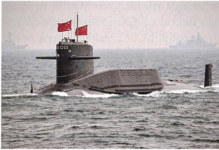
U-Boot der Jin-Klasse.

men (Aden) durch die People Liberation Army Navy (PLAN) evakuiert 21 . Diese Auftritte dienen China in zweierlei Hinsicht. Erstens wird der Weltöffentlichkeit die eigene «Blue Water» 22 -Kapazität vor Augen geführt und zweitens sammelt die PLAN wertvolle Erfahrungen in der internationalen Zusammenarbeit und für die eigene, sich in der Entwicklung befind-