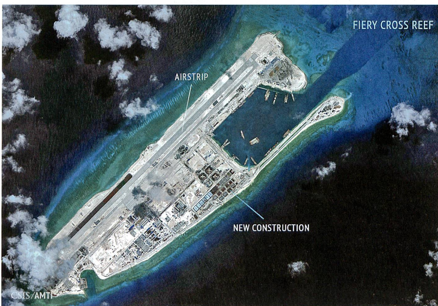
Aufschüttungen auf Fiery Cross Reef (Spratly Inseln); Stand 03.09.2015.

have illegally occupied. [...] It is thus a long standing task for China to safeguard its maritime rights and interests.» 17