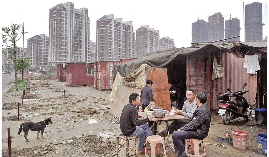
Karges Neujahrsfest der Wanderarbeiter.

krankungen der Atemwege, in der Belegschaft wiederum zu höheren Kosten des Gesundheitssystems. Die Regierung steht vor der Problematik, dass die dringend notwendige Reduktion dieser Verunreinigungen zugleich aber eine Reduktion der ökonomischen Wachstumsrate bedingt, deren Erhöhung sie aber dauernd verspricht. Die Schliessung ineffizienter Werke wiederum würde zu vermehrter Arbeitslosigkeit führen; die Zahl der sogenannten Wanderarbeiter in China beläuft sich schon jetzt auf über 250 Millionen! Als Sofortmassnahme sind eine Reduktion der Smogbelastung um 25% sowie eine Verringerung des Kohleverbrauchs zu Gunsten erneuerbarer Energien innert zwei Jahren vorgesehen. Ob dies realisiert werden kann, erscheint indes zweifelhaft.