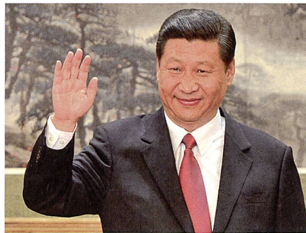
Xi, Jinping, Staatspräsident der Volksrepublik China.

Einschätzung wird China möglicherweise nach innen derart viel Kraft aufwenden müssen, dass es nicht mehr in der Lage sein wird, nach aussen eine Vorherrschaft auszuüben.