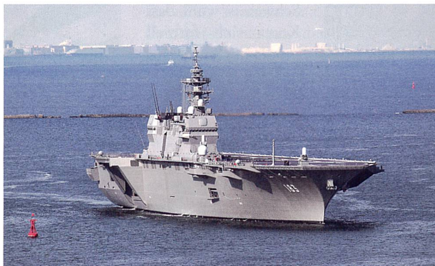
Erneuerung der SDF in kleinen Schritten: Der Helikopterträger Izumo wurde 2015 in Dienst gestellt, das Schwesterschiff Kaga folgt 2017. Beide Schiffe können grundsätzlich F-35B Kampfflugzeuge aufnehmen.

China hat enorm aufgerüstet und modernisiert seine Streitkräfte weiter. An der Militärparade in Beijing im September