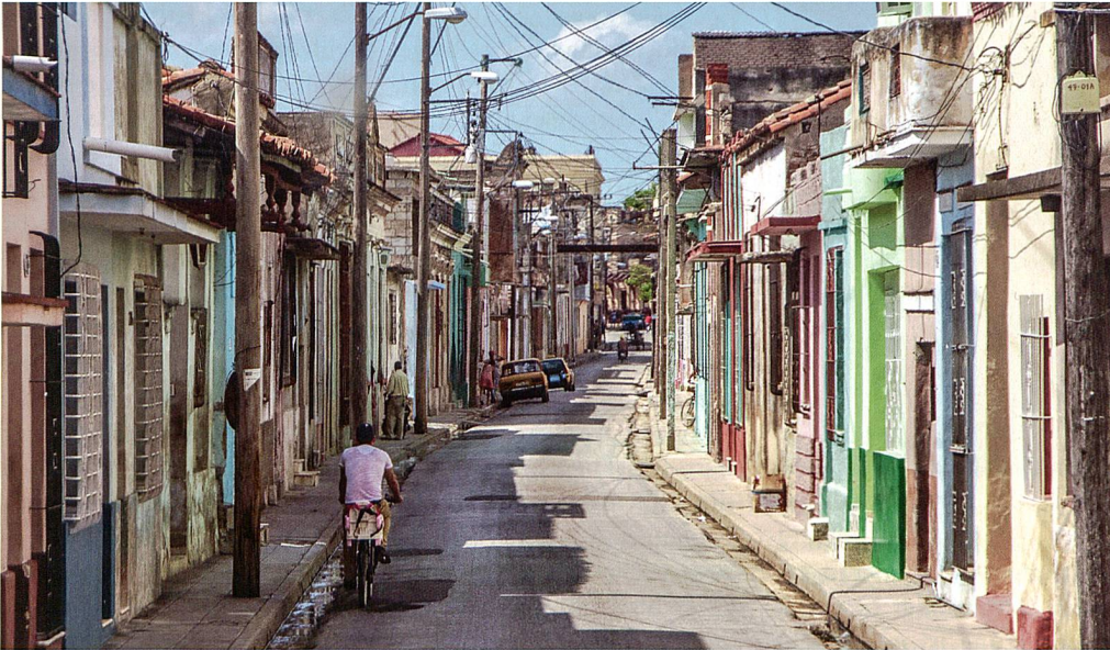
Kuba ohne Charme.

In den USA selber stossen die Ziele und Massnahmen des Präsidenten nicht nur auf Gegenliebe. Die Republikaner äussern ihre Skepsis: Kuba hat noch keine konkreten Massnahmen zur Normalisierung ihrer Beziehungen zu den USA eingeleitet. Warum sollten es die USA unilateral tun. Aber auch Kreise, die den Demokraten nahe stehen, äussern Zweifel. Sie haben die grossen Enteignungen des kommunistischen Kuba nicht vergessen und verlangen entweder Ausgleichszahlungen oder die Wiederinstitution ihrer Kuba-Eigentümer.