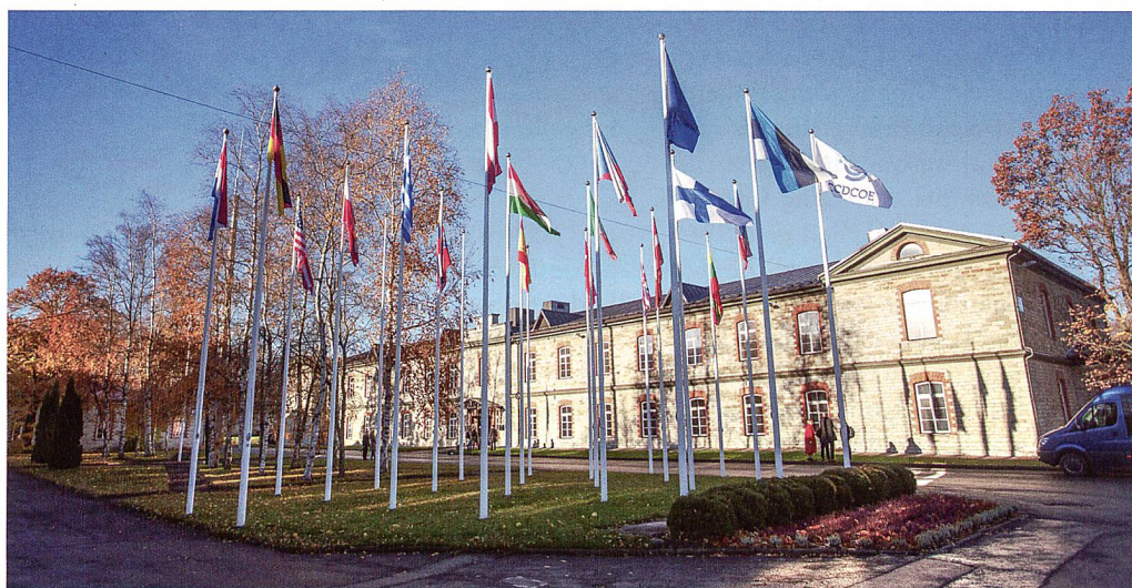
Neu mit Finnischer Flagge – CCDCOE in Tallin.

Am 3. November 2015 ist Finnland dem Kompetenzzentrum Cyber Abwehr (NATO Cooperative Cyber Defence Centre of Excellence, CCDCOE) in Estland als sogenannte «Contributing Nation» beigetreten. Mit diesem Schritt fanden die 2013 begonnenen Beitrittsverhandlungen ihren Abschluss. Mitwirkende sind jene Nicht-NATO-Länder, welche als Partner-Nation (PfP) dem CCDCOE als Teil der grösseren Cyber Defence Community der Allianz beitreten. Bisher Österreich und neu nun Finnland. Gleichzeitig wurden die NATO-Länder Griechenland und Türkei als «Sponsoring Nations», also vollwertige Mitglieder aufgenommen. Zum Beitritt meinte der Direktor des CCDCOE,