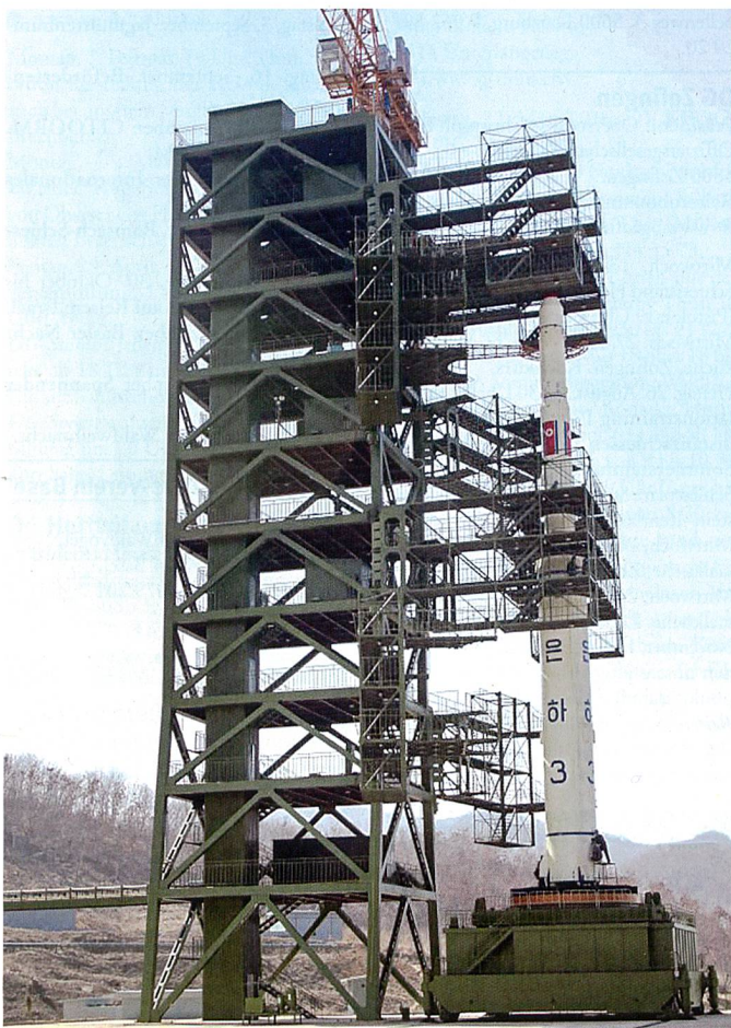
Bald auch U-Boot tauglich?

Die südkoreanische Regierung teilte damals hingegen mit, sie glaube, die Rakete sei von einem U-Boot abgefeuert worden, allerdings lediglich 100 bis 150 Meter weit geflogen. UNO-Resolutionen verbieten Nordkorea den Start ballistischer Raketen. Im Zeitraum von 2006 bis 2013 hat Nordkorea drei Atomtests durchgeführt.