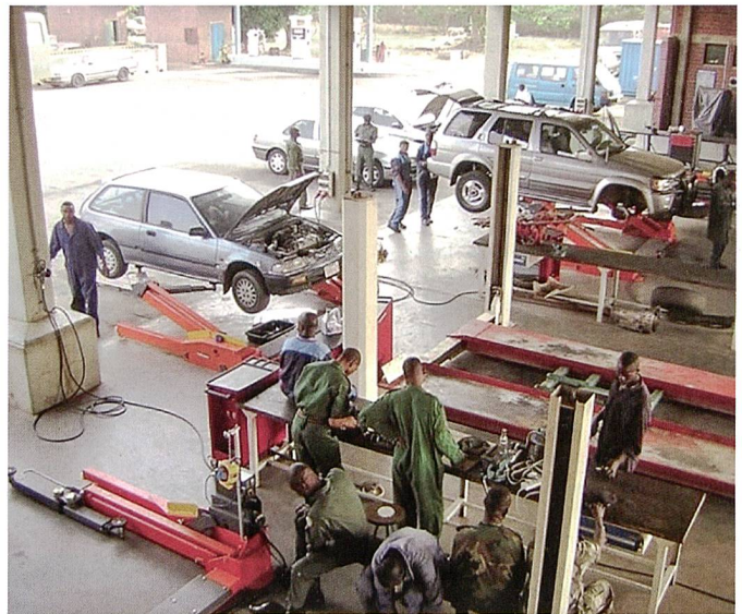
Werkstatt der Instandhaltungsschule in Abuja.