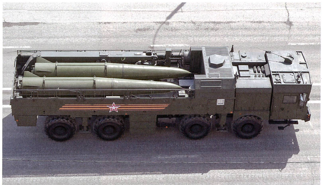
ISKANDER-M am «Tag des Sieges» im Mai 2015.

chen Test verkündete der stellvertretende Chef der russischen Raketentruppen, dass dem ISKANDER-M-System, auf-