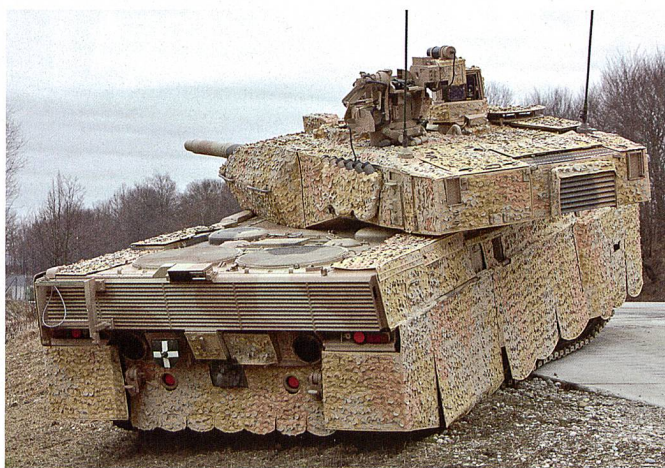
Leopard 2 A7+.

Das Sultanat Oman ist in Verhandlungen über die Beschaffung von Panzern aus dem Hause Krauss-Maffei Wegmann (KMW). Das Geschäft könnte einen Umfang von etwa 2 Milliarden Euro haben, und bis zu 70 Panzer des Typs Leopard 2 A7+ inklusive Wartung, Training und Truppenimplementierung beinhalten. Für den Kampf in urbanem Gelände entwickelt, verfügt das von