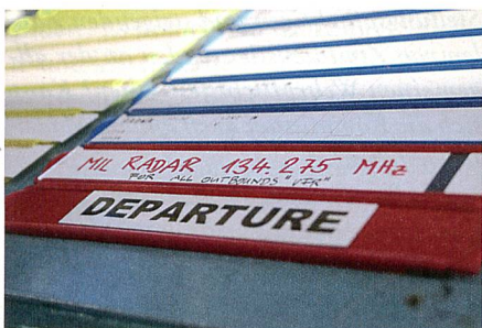
Einflug in LS-R 90: Über die Frequenz MIL RADAR wird der Flugverkehr koordiniert.

Klar ist, dass die Verringerung von Personal auch die Luftwaffe zu schlankeren und noch effizienteren Strukturen und Prozessen zwingt. Hier bedarf es künftig einer noch genaueren Personalplanung, um für jeden Einsatz der Luftwaffe einen einsatzfähigen und kompetenten Stab zu gewährleisten. Diese Verschlinkung bietet einige Vorteile. In den letzten Jahren hat sich die Positionierung der Luftwaffe im Gesamtrahmen verändert. Die Luftlage entwickelt sich weltweit sehr rasch und soll ständig neu beurteilt werden. Subsidiäre Einsätze zu Gunsten der Behörden im Inland, aber auch Spontanhilfe im Ausland müssen rasch und effizient geleistet werden können. Fast alle diese Einsätze haben JOINT-Charakter und brauchen deshalb eine einheitlich verständliche und kompatible Kommandoführung. Man kann abschliessend feststellen, dass die klassischen Stabsführungs-Disziplinen für die Luftwaffe stets wichtiger werden.