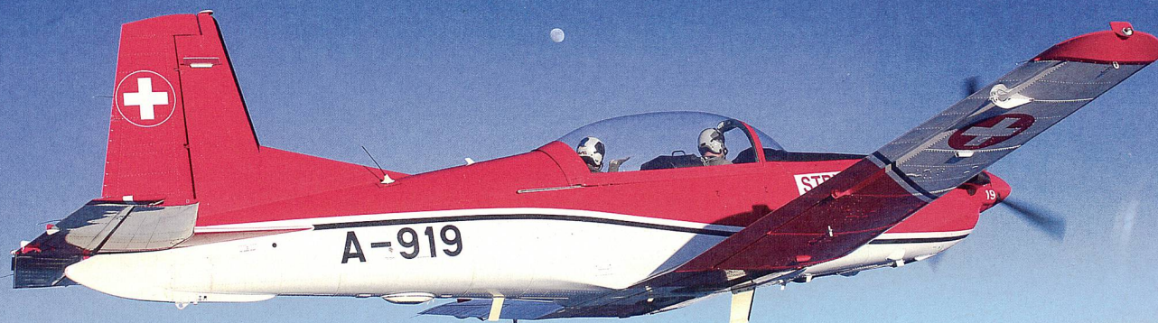
SIMBA 9 unterwegs: In wenigen Minuten ist die Crew der PC-7 «on station».

Erstmals reichte die Sperrzone LS-R 90 über dem Kongressstandort Davos am diesjährigen World Economic Forum auch im Engadin bis zum Grund. Während für die zivilen Piloten die fliegerischen Prozesse durch diese Anpassung etwas vereinfacht werden konnten, bedeutete es für die Controller der Bewegung und Koordination (BEWEKO) in der Einsatzzentrale Luftverteidigung (EZ LUV) in Dübendorf hingegen tendenziell mehr Arbeit als bisher.