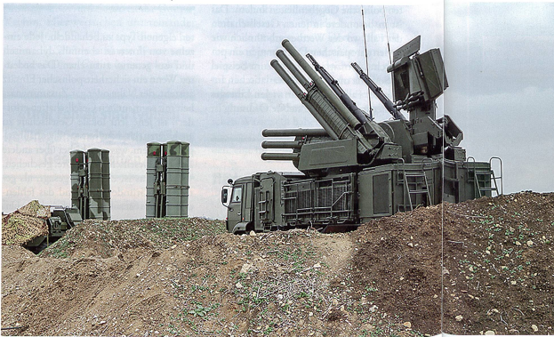
Russische Flugabwehrbatterie bei Latakia.

satz, die von Schiffen aus dem Schwarzen Meer abgefeuert wurden.