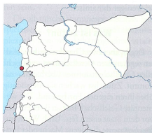
Tartus in Syrien.

Am 30. September – zwei Tage nach der Rede des russischen Präsidenten vor der UNO – erfolgten die ersten Luftangriffe auf Stellungen des IS, aber auch gegen bewaffnete oppositionelle Gruppen, die gegen die regulären syrischen Streitkräfte mit dem Ziel kämpften, Präsident Assad zu stürzen. Bereits nach einer Woche waren die russischen Luftstreitkräfte in der Lage, die Einsätze von zunächst knapp 10 auf 90 zu steigern. Nach sehr kurzer Zeit flogen Moskaus Piloten mehr Einsätze am Tag als die westliche Allianz unter Führung der USA innerhalb eines Monats. Die arabischen Mitglieder der Allianz flogen in 2016 fast gar keine Einsätze mehr, weil sie den grössten Teil ihrer Kampfflugzeuge für Einsätze gegen die Huthi-Rebellen im Jemen benötigten.