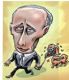
Karikatur: Umgang Putins mit den Medien. Bild: Wikipedia/von Wellemann

• Durch den zwischen dem amerikanischen Aussenminister Kerry und seinem russischen Kollegen Lawrow ausgehandelten und bislang weitgehend eingehaltenen Waffenstillstand hat Russland entscheidenden Anteil an der Wiederauf-