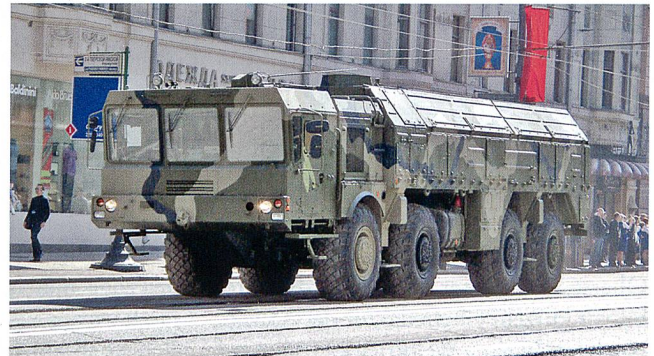
Iskander Rakete auf Trägerfahrzeug MZKT 7930.

te 2016 gar der Ernstfall eintreten, dann ist aufgrund der bisherigen Erfahrungen mit Obama im Krieg in Syrien vorstellbar, dass er eine russische Aggression nur zögernd mit militärischen Mitteln abwehren und deshalb die Unterstützung der USA für die Europäer mit Verspätung eintreffen würde.