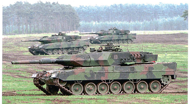
Leopard 2A5 der Bundeswehr.