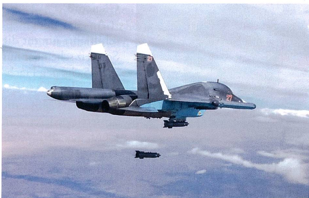
Eine russische Su-34 beim Abwurf einer KAB-500S-Präzisionsbombe am 9. Oktober 2015 während des Einsatzes in Syrien.

Dank der Umsetzung des Aufrüstungsprogramms und der leistungsfähigen Rüstungsindustrie kann Russland auch an zwei geopolitisch sehr unterschiedlichen Orten gleichzeitig Krieg führen. In und über Syrien testete die russische Führung bis anhin ihre Luftstreitkräfte (Luftraumstreitkräfte) aus, indem die Erdkampfflugzeuge Su-25 und Jagdbomber Su-24 und Su-34 sowie Mittelstreckenbomber Tu-22M über die syrische Opposition Bombenteppiche von Freifall-Splitterbomben hoher Explosivwirkung abwarfen. Hin und wieder wurden durch strategische Bomber Tu-95 und Tu-160 luftgestützte Marschflugkörper (Kh-55/SM und Kh-102) und seegestützte Marschflugkörper Kalibr gegen Ziele in Syrien eingesetzt. Den Nachschub für die russischen Kampfflugzeuge in Syrien leisten Transportflugzeuge An-124 oder Il-76 oder/und Transportschiffe über den Bosphorus zum russischen Hafen Tartus in Syrien.