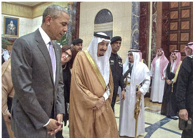
Präsident Obama und King Salman, 29. April 2016, Riad.

Washington setzte danach auf den Irak unter Saddam Hussein als neue zweite Säule. Diese wurde durch den Überfall des irakischen Herrschers auf das Emirat Kuwait im August 1990 zum Einsturz gebracht. Bereits vor dem offiziellen Beginn der «Operation Desert Storm» wurden amerikanische Truppen nach Saudi-Arabien verlegt und US-Fallschirmjäger landeten in Dahran, um den ARAMCO-Computer zu sichern.