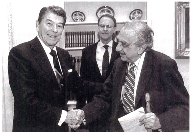
Präsident Reagan und Edward Teller, Erfinder der Wasserstoffbombe und Befürworter des SDI-Programms.

Wie aber konkret mit Moskau über ein neues System sprechen, das es nach russischer Auffassung gar nicht gibt? Problematisch in diesem Zusammenhang ist, dass nach Beseitigung aller Raketen und Trägermittel das Verifikationsregime für den INF-Vertrag inaktiv geworden ist. Folgt man der Diskussion in den einschlägigen Expertenkreisen, so kann dort mangels Fakten keine Klarheit über den von den USA indizierten Marschflugkörper herrschen. Mögliche «innerfamiliäre» Adaptionen zwischen See-, Luft- und Landsystemen gestalten die Lage unübersichtlich. Möglicherweise liegt genau hier der Ursprung der Krise des INF-Vertrages. Vorstellbar ist durchaus, dass Russland es bei Tests im Verborgenen nicht so genau genommen hat. Von den USA damit konfrontiert, hätte Moskau dann Vor- und Nachteile eines Verlassens des Vertrages neu abgewogen und sich in Folge für die dargestellte Position pro Vertrag entschieden. In Konsequenz wird Russland, so die Prognose, in absehbarer Zeit keinen Anlass mehr für Vorwürfe der Vertragsuntreue geben. Möglicherweise waren