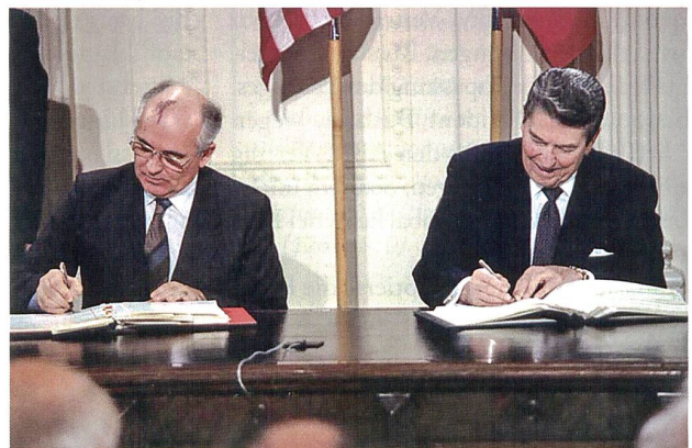
Mikhail Gorbatschow und Ronald Reagan unterzeichnen den INF-Vertrag, 1987.

Iskander ist eine moderne ballistische Kurzstreckenrakete, die seit 2005 in die russischen Streitkräfte eingeführt wird. Sie gilt als vergleichsweise punktgenau. Ihre Dislozierung im Oblast Kaliningrad ist seit Jahren in Rede stehend, die Annexion der Krim eröffnet neue Stationierungsoptionen. Die explizite Erwähnung der vertragsrelevanten 500 km-Grenze bei bodengestützten Systemen («Landkomplexen») soll offenkundig gleichzeitig den fortge-