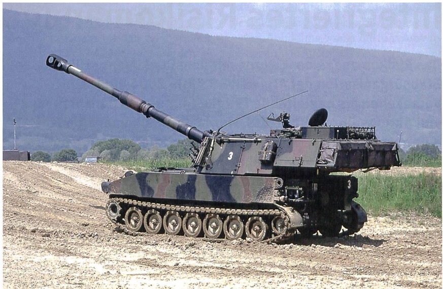
Panzerhaubitze M-109 KAWEST.

Im Jahr 2009 wurden die 12-cm-Panzerminenwerfer ausser Dienst gestellt, so dass heute die Infanterie- und Panzerbataillone über keine indirekte Feuerunterstützung auf kurze Distanz (-10 km) verfügen. Mit dem im Rüstungsprogramm 2016 enthaltenen Mörser soll diese Lücke bis im Jahr 2022 geschlossen werden. Die Feuerunterstützung auf mittlere Distanz basiert heute auf der Panzerhaubitze