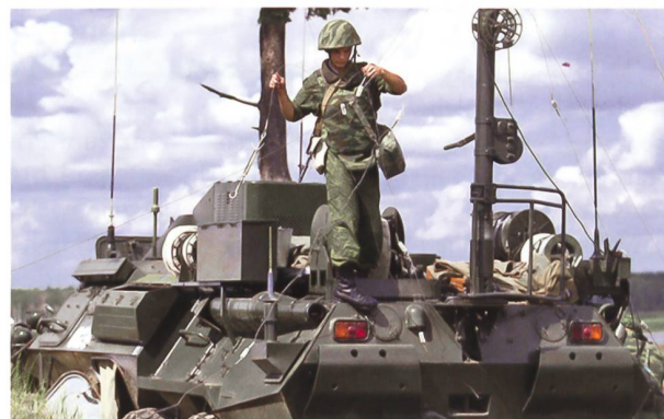
Mittel der EKF auf taktischer Stufe.

Aufsehen erregte bei westlichen Beobachtern die Beübung von Teilen der nuklearen Einsatzkräfte. So erfolgte am letzten Tag der Manöver der Abschuss einer bodengestützten ICBM vom Typ RS-24