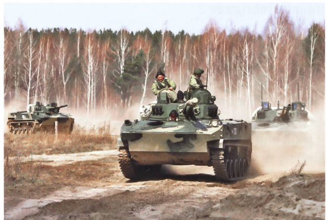
Neue Luftlandepanzer BMD-4M.