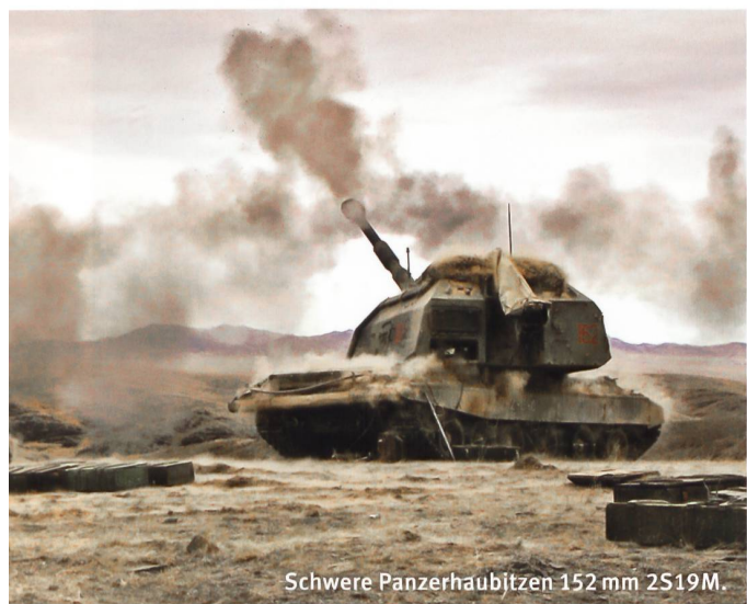
Schwere Panzerhaubitzen 152 mm 2S19M.

«Zapad 2017» war für Russlands Militärführung von besonderer Bedeutung. Mit dieser Übungsreihe sollten die umfassenden Veränderungen in diesem MB unter möglichst kriegsnahen Bedingungen ausgetestet werden. Dabei dürfte der verstärkte Einsatz von Mitteln der Elektronischen Kriegführung eine zentrale Rolle gespielt haben. Zudem sind vermutlich auch erste Erkenntnisse aus den beiden letzten Konflikten (Ukraine/Krim und Syrien) in diesen Manöverübungen berücksichtigt worden. ■