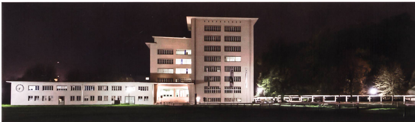
Das Kommando HKA am Armee-Ausbildungszentrum Luzern, Brennspiegel der Milizkader, am 30.10.2017.