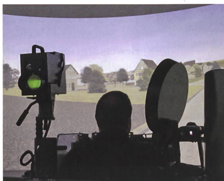
Oben: Lt Rohr im Simulator.