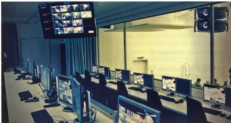
Kommando- und Steuerzentrale im Kartenraum.

Anlässlich eines Verbandstrainings, welches letztes Jahr im Wiederholungskurs stattfand, wurden Punkte identifiziert, die für unseren Einsatz wichtig sind und nicht optimal funktionierten. Die Übungsanlage entsprach einer Erdbebensituation in Basel. Das Verkehrs- und Transportbataillon 1 wurde zu Gunsten der zivilen Behörden als Sensoren der ersten Stunde eingesetzt. Dabei kristallisierte sich die Kommunikation als kritisches Element heraus. Die Fachkenntnisse wie Fahrleistung, Kartenlesen und Funkdisziplin wurden dabei sehr gut ausgeführt. Es waren Informationsinhalte und tech-