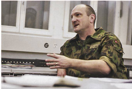
Abb. 3: Voraussetzung für ein erfolgreiches Risikomanagement ist eine positive Fehlerkultur.

wird. Dabei ist stets darauf zu achten, den «credible worst case», also den schlimmsten, aber noch möglichen Fall zu prüfen. In der FU Br 41 / SKS wurde beispielsweise festgestellt, dass die Gefahr besteht, dass neue militärische Systeme eingeführt werden könnten, die nicht truppentaug-