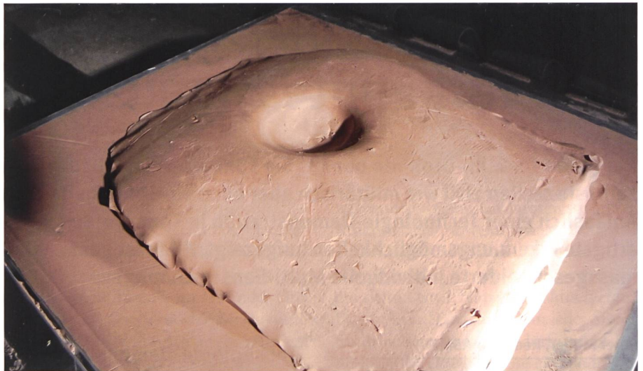
Verformung des Hintergrundmaterials (Plastilin = Simulation des menschlichen Körpers) nach Beschuss des Schutzpakets.

Prüfstelle ist Mitglied der VPAM (Vereinigung der Prüfstellen für Angriffshemmenden Materialien und Konstruktionen) und seit 1995 nach STS 0118 (ISO 17025) Normen akkreditiert. Der Geltungsbereich der Prüfstelle bezieht sich auf den Beschuss von Körperschutz oder Schutzwerkstoffen. So werden zu Gunsten der Beschaffung für die Armee sämtliche Schutzbekleidungen getestet, sei es bei der Evaluation oder bei der Abnahme (stichprobenweise). Bei der Prüfung von Schutzwesten und