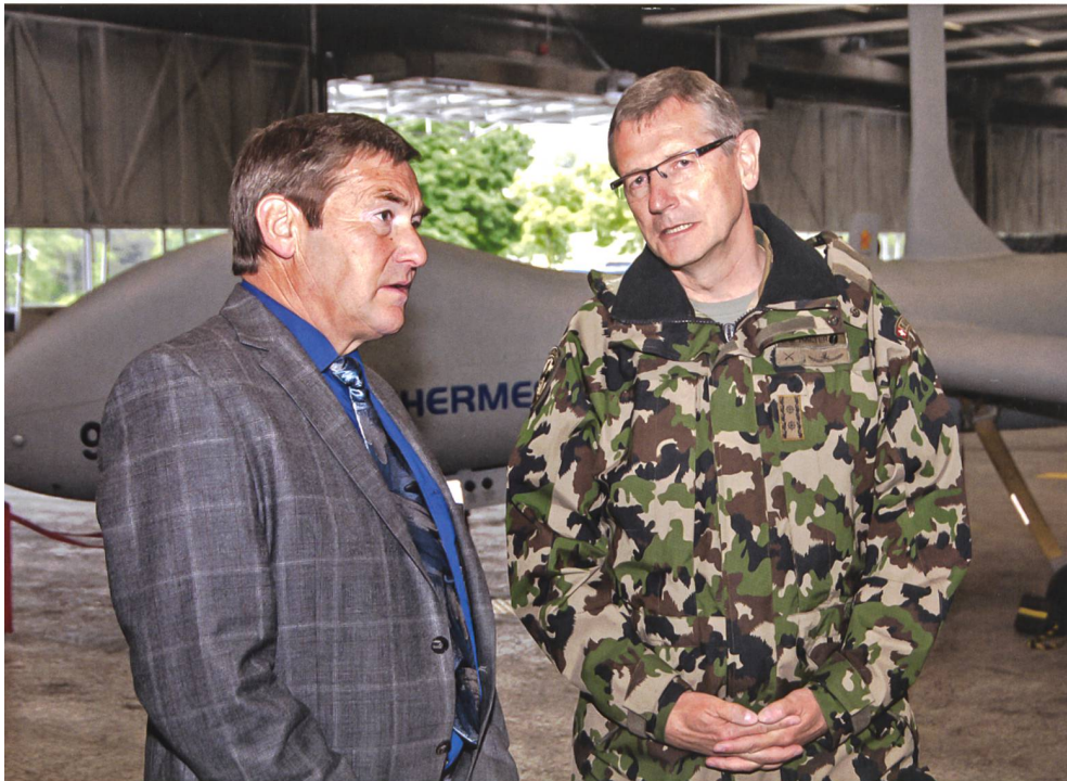
Rüstungsmaterialausstellung für Mitglieder der SiK.

nisation, Ausbildung, Material, Personal, Finanzen, Immobilien, Informatik und Integrale Sicherheit (DUOAMPFIS) angesteuert.