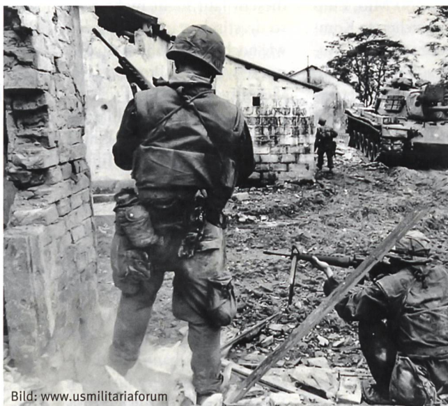
US-Marines während der Tet-Offensive in Hue.

Neben rein humanen Motiven haben wir beim Kampf um (unsere!) Städte noch zwei weitere handfeste Motive, die Zerstörungen auf ein Minimum zu begrenzen: a) Aus Rücksicht auf den späteren Wiederaufbau und b) in Gedanken daran, dass Häuserruinen erfahrungsgemäss dem Verteidiger eine noch bessere Deckung bieten als intakte Gebäudestrukturen.