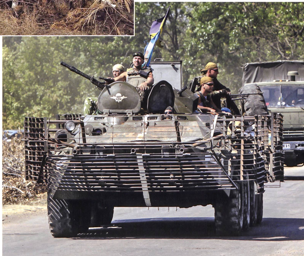
Ukrainischer Schützenpanzer BTR-4 mit Slat/Käfigpanzerung.

Bei den beiden Kriegsparteien werden zu einem wesentlichen Teil veraltete Kampfpanzer der Typen T-64BV sowie T-72B respektive T-72BV eingesetzt. An