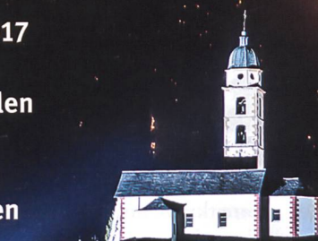
Waldbrand im Raum Mesocco.

Vom 27. Dezember 2016 bis am 12. Januar 2017 bekämpften täglich bis zu 100 Einsatzkräfte mit Unterstützung von militärischen und zivilen Löschhelikoptern die Waldbrände im Misox und im Calancatal (GR). Die Zusammenarbeit zwischen den betroffenen Gemeinden und den beteiligten Partnern Kantonspolizei, Feuerwehr, Forstdienst, Sanität, Zivilschutz und Schweizer Armee erfolgte kooperativ und war von gegenseitigem Vertrauen geprägt.