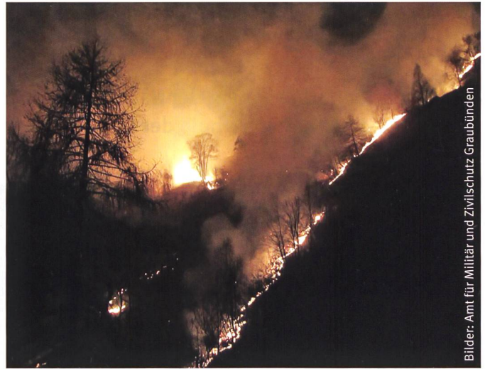
Waldbrand im Calancatal.